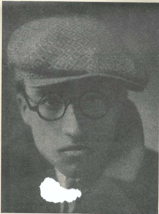
Una delle rare fotografie giovanili di Pavese. A diciassett'anni, al tempo della sua affascinata scoperta della città, e dei suoi primi tentativi poetici.

Difatti, a apertura di pagina, ci accorgemmo di avere di fronte un documento impressionante, pagine convulse, grida di disperazione, che traboccano clamorose ogni tanto, certo in seguito a episodi, a incontri, a delusioni che il diario non ci racconta ma ci lascia soltanto intravedere. Ma vi troviamo anche, soprattutto, dell'altro: il termine antitetico alla disperazione e alla sconfitta: una paziente, tenace fatica d'autocostruzione, di chiarezza interiore, di miglioramento morale, da raggiungere attraverso il lavoro e la riflessione sulle ragioni ultime dell'arte e della vita propria e altrui. Così la figura di Pavese, che avevamo imparato ad amare come quella del poeta e dell'amico più forte e ostinato e rigoroso, si ricomponeva di fronte a noi dopo lo choc tremendo della sua fine, ancor più forte e ostinata e rigorosa, ora che avevamo sotto gli occhi la testimonianza di quale sforzo, di quale lotta egli avesse per anni sostenuto con l'oscura inclinazione del suo animo a assorbire dalla vita tutti i motivi di sofferenza.