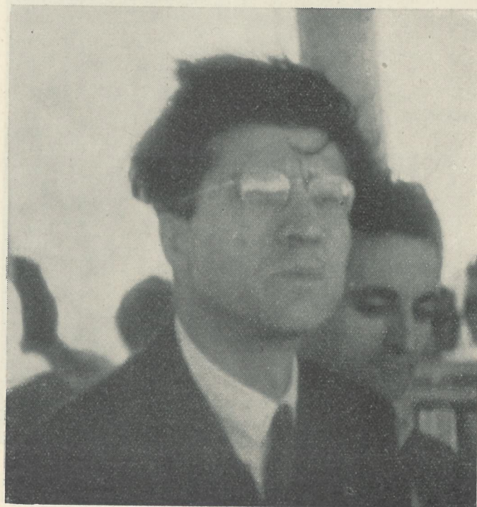
A quarantadue anni, scrittore ormai sicuro della sua maturità, ma sempre, sotto la scorza d'impassibilità, trepido e sensibile come un ragazzo.