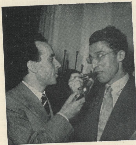
Tra diffidente e ironico, Pavese risponde alle domande d'un intervistatore radiofonico.

Tra gli scritti su La luna e i falò usciti dopo la morte dell'autore, riportiamo due brani, da quelli di Piero Jahier (« Il Ponte », novembre 1950) e di Franco Fortini (« Comunità », settembre-ottobre 1950).